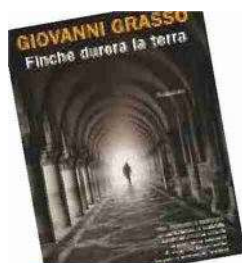
La copertina del romanzo di Giovanni Grasso edito quest'anno da Rizzoli

Chiedo ai familiari più stretti e ad alcuni amici scrittori.