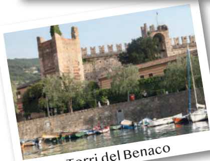
Torri del Benaco