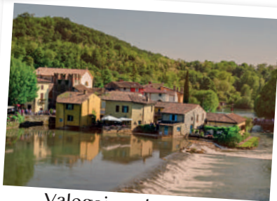
Valeggio sul Mincio