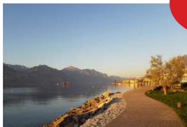
Brenzone sul Garda