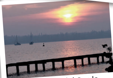
Castelnuovo del Garda