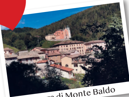
Ferrara di Monte Baldo