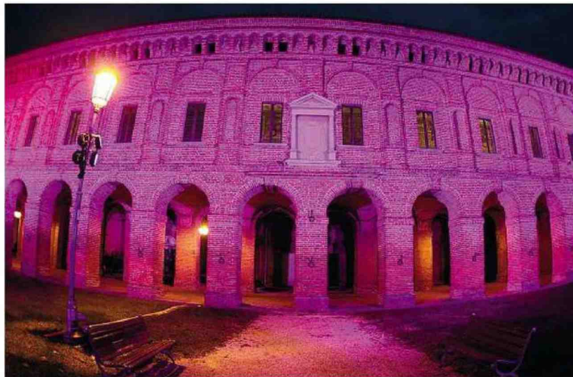
Patrimonio La Galleria degli Antichi di Sabbioneta illuminata di rosa: il paese in provincia di Mantova è patrimonio Unesco e ospiterà il 9 luglio la partenza della terza tappa del Giro donne

Da sinistra, piazza della Loggia, Brescia; la torre campanaria della chiesa di San Rocco, Manerba; il castello di Desenzano sul Garda