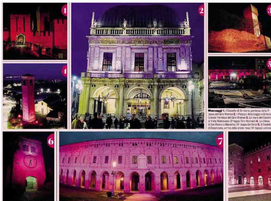
Da non perdere 6. La Torre dell'Orologio di Castiglione delle Stiviere, partenza della 14ª tappa (crono) del Giro 7. La Galleria degli Antichi a Sabbioneta, edificata tra il 1583 e il 1586, composta da 26 arcate e lunga 97 metri: qui prenderà il via la 3ª tappa del Giro Women 8. Il Palazzo Comunale di Cremona piazza Stradivari: la città del torrione ospiterà una tappa del Giro Next Gen (U 23) L'Espresso