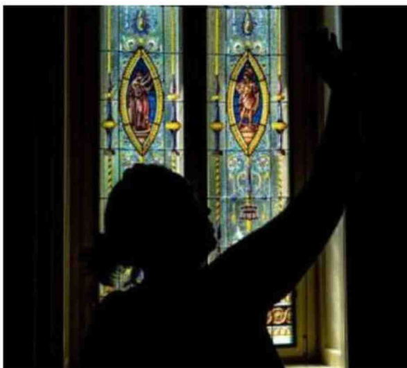
Riprendono vita in mostra luoghi e personaggi interpretati da Maria Callas

«Forse perché i nomi delle eroine non vengono ripetuti abbastanza spesso per diventare un mito. Forse perché non c'è mai un lieto fine nelle loro storie. Niente d'ispirazione nel fallimento di una donna. Tuttavia, il nome di